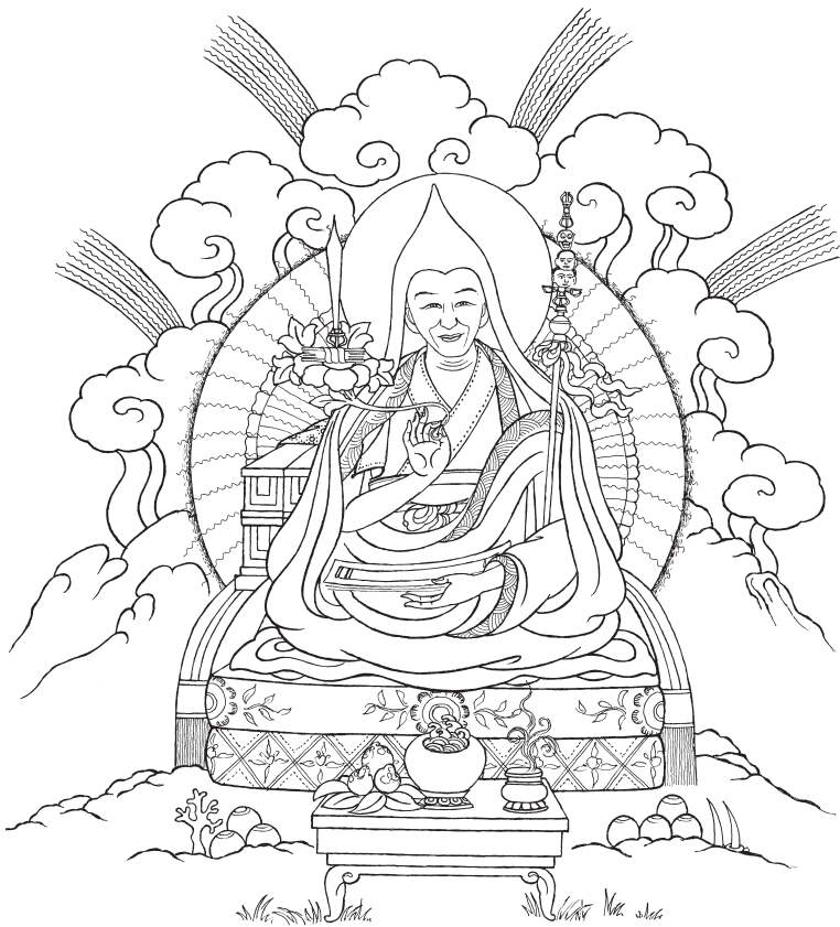
Kyabyhe Triyhang Rimpoché