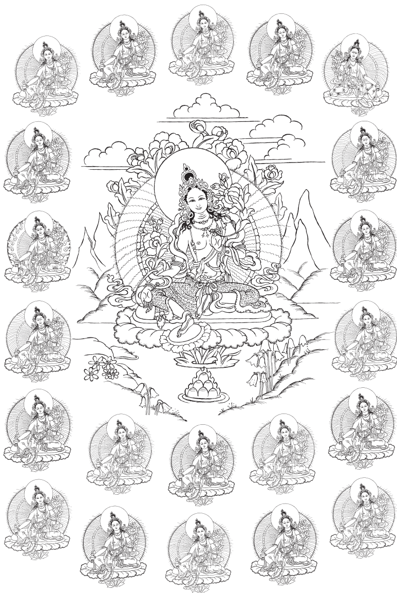
Las veintiuna Taras